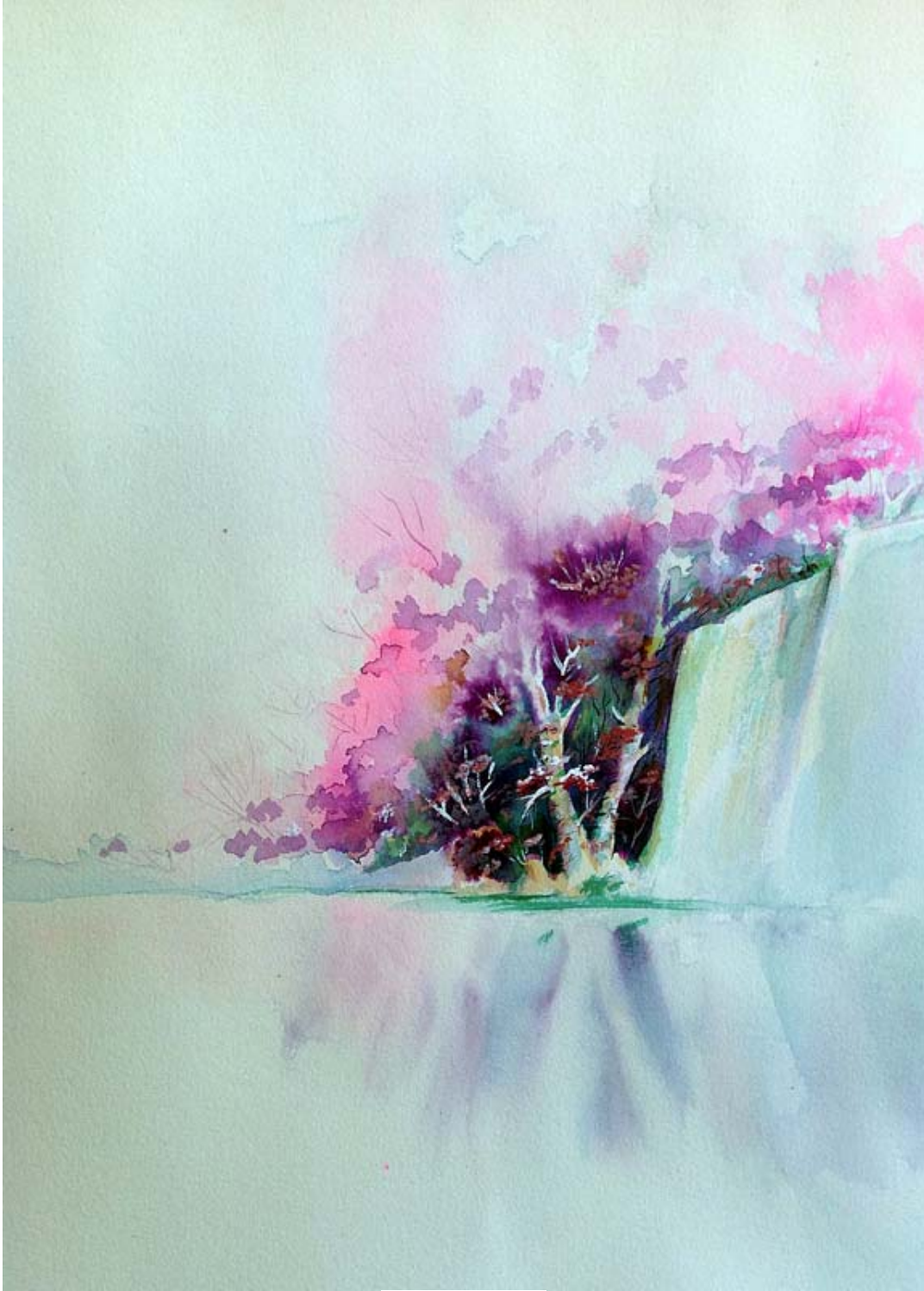
آبرنگ، سال ۱۳۷۸