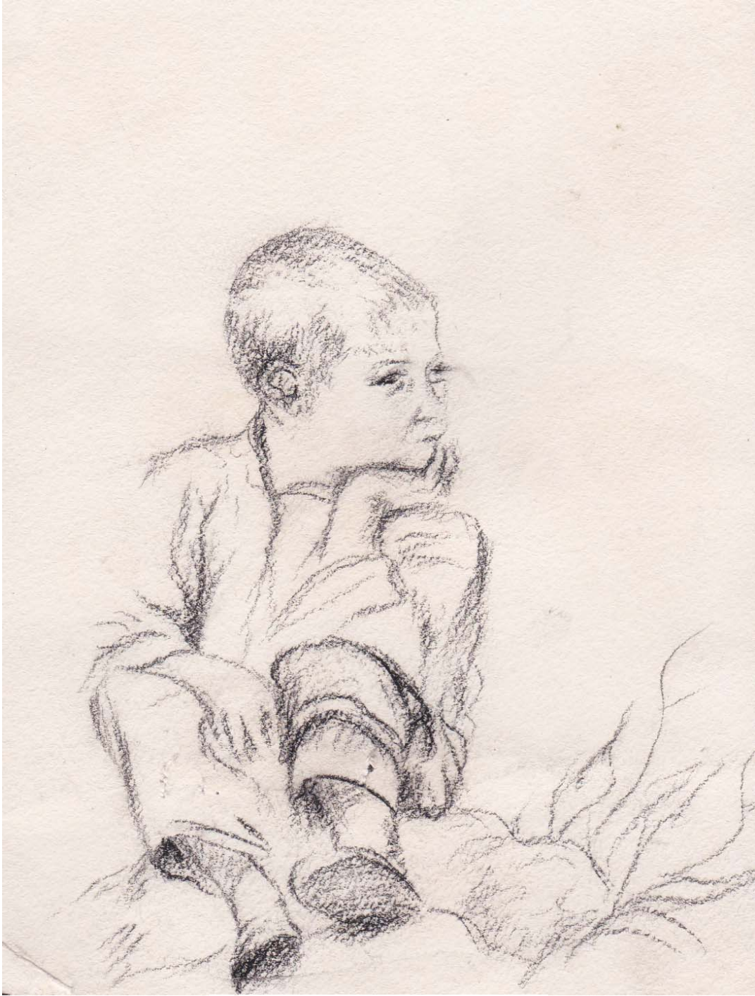
زمستان ۱۳۴۷. یک طرح ساده با سیاه قلم (۲)