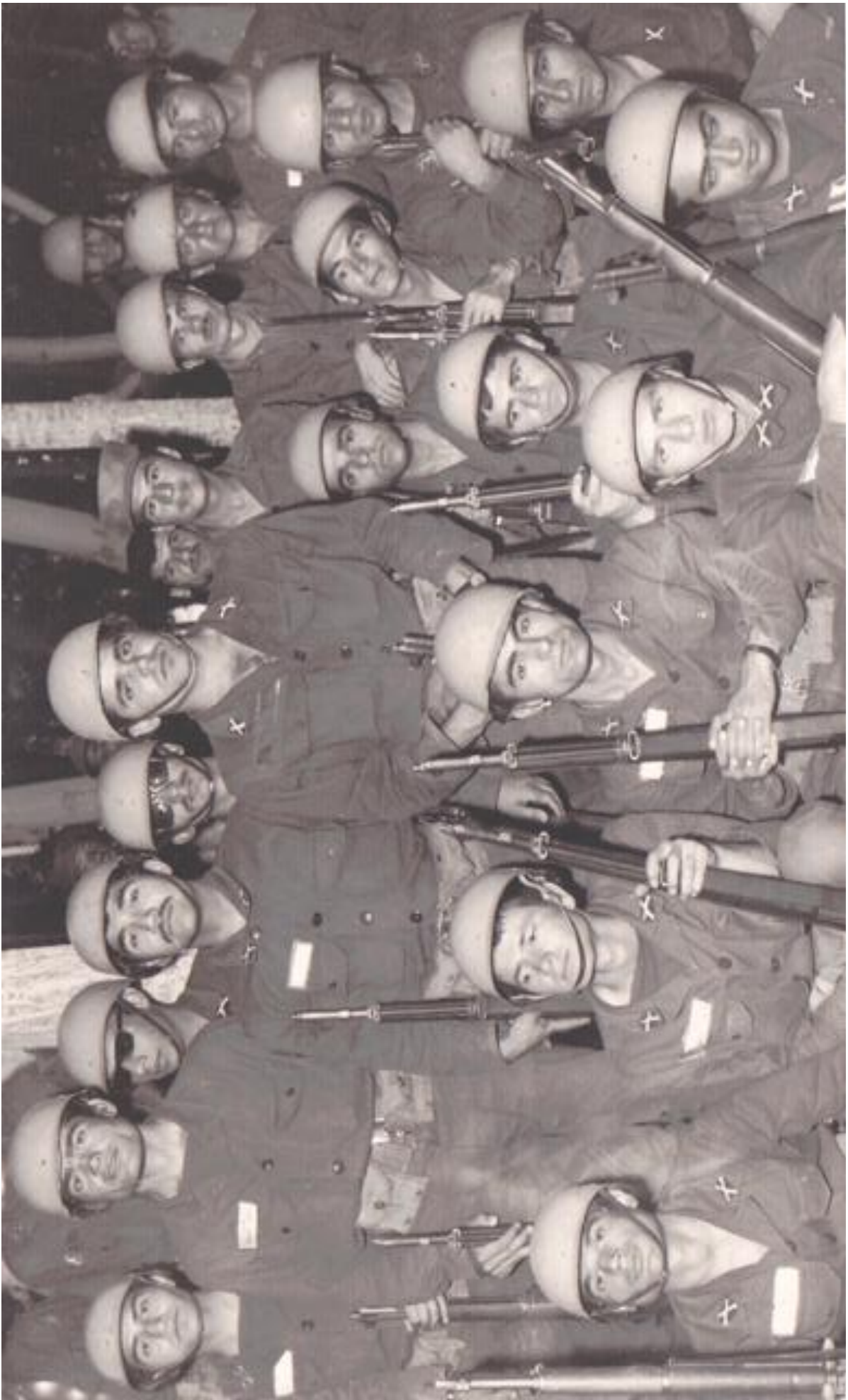
عکس نگارنده در ردیف نشسته از طرف چپ، دومین تن