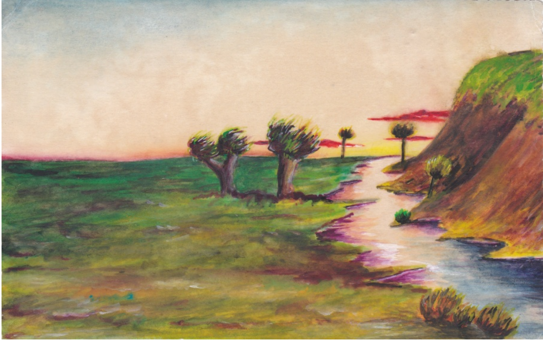
آبرنگ، سال ۱۳۴۰