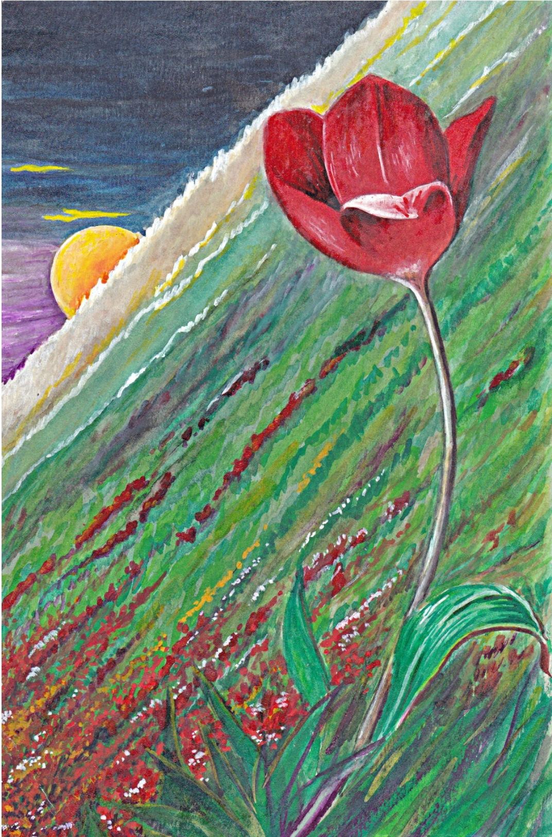
آبرنگ، غروب کوهستان ۱۳۴۲