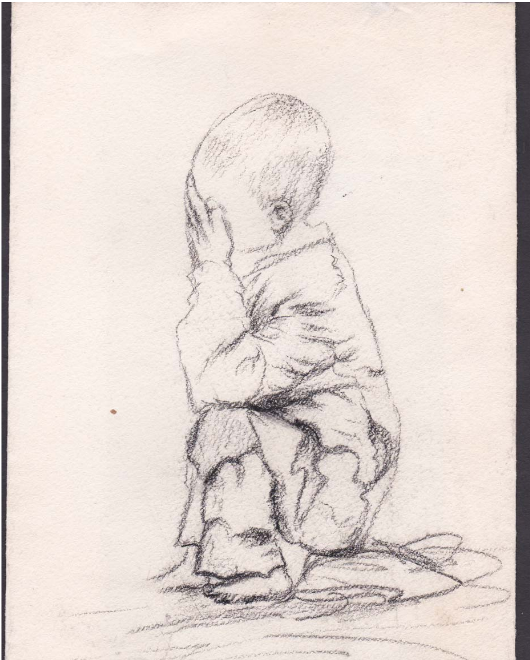
زمستان ۱۳۴۷. یک طرح ساده با سیاه قلم (۱)

دخترانِ جوان کرد به هنگامِ راه رفتنِ غرور آمیزشان شکوه زیبای زندگی را با هر ضربه گامی به نمایش می‌گذارند. بدنم به شدت خسته بود. دو شبانه روز بود که نخوابیده بودم. زمان پرواز دو ساعت بود. به خوبی می‌دانستم که در این دو ساعت و در درون این پرنده آهنین و در میان آسمان دست هیچ دژخیمی به من نخواهد رسید. با خود گفتم: «ایرج بخواب تا برای نبردی دیگر آماده باشی!» پرنده آهنین همچون گهواره‌ای مرا به خواب ژرفی فرو برد.