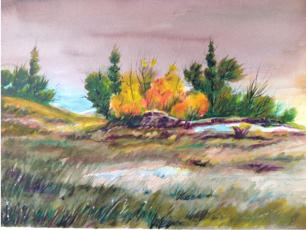
آبرنگ، سال ۱۳۷۸