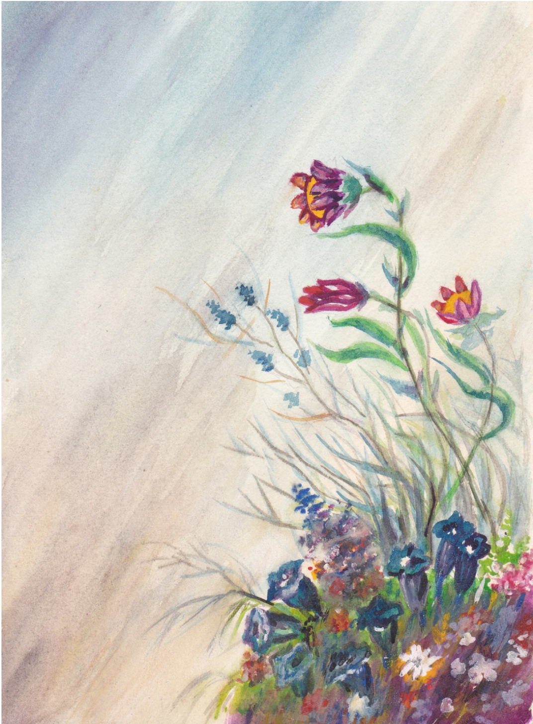
آبرنگ، بهار کوهستان، سال ۱۳۴۴