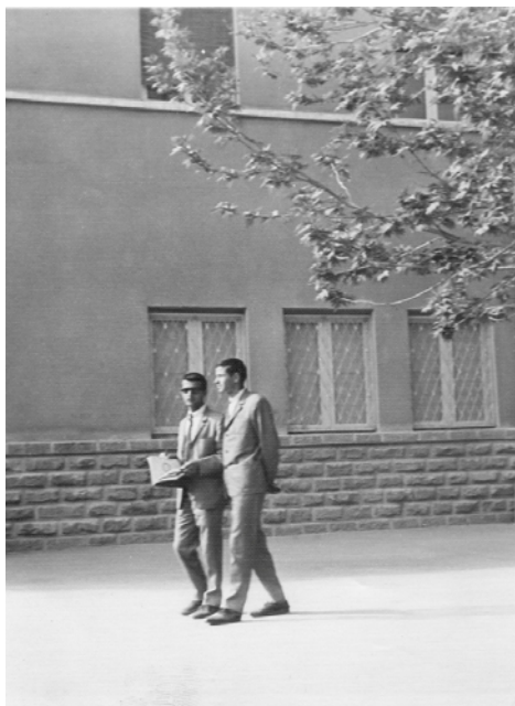
دانشکده پزشکی ۱۳۴۷

اکنون برای مبارزه آماده بودم، تنها می‌بایست یافت می‌شدم.