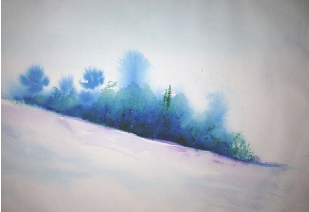
آبرنگ، زمستان ۱۳۷۸