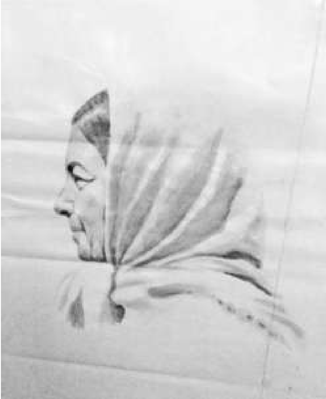
نقاشی از چهره مادرم، آبرنگ، سال ۱۳۵۲