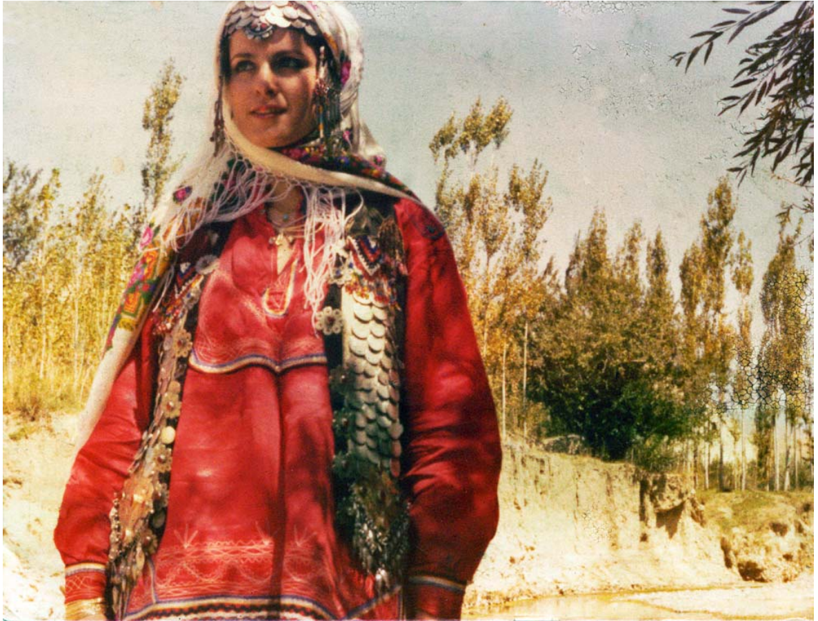
لباس کردهای منطقه اوغاز کردستان خراسان.