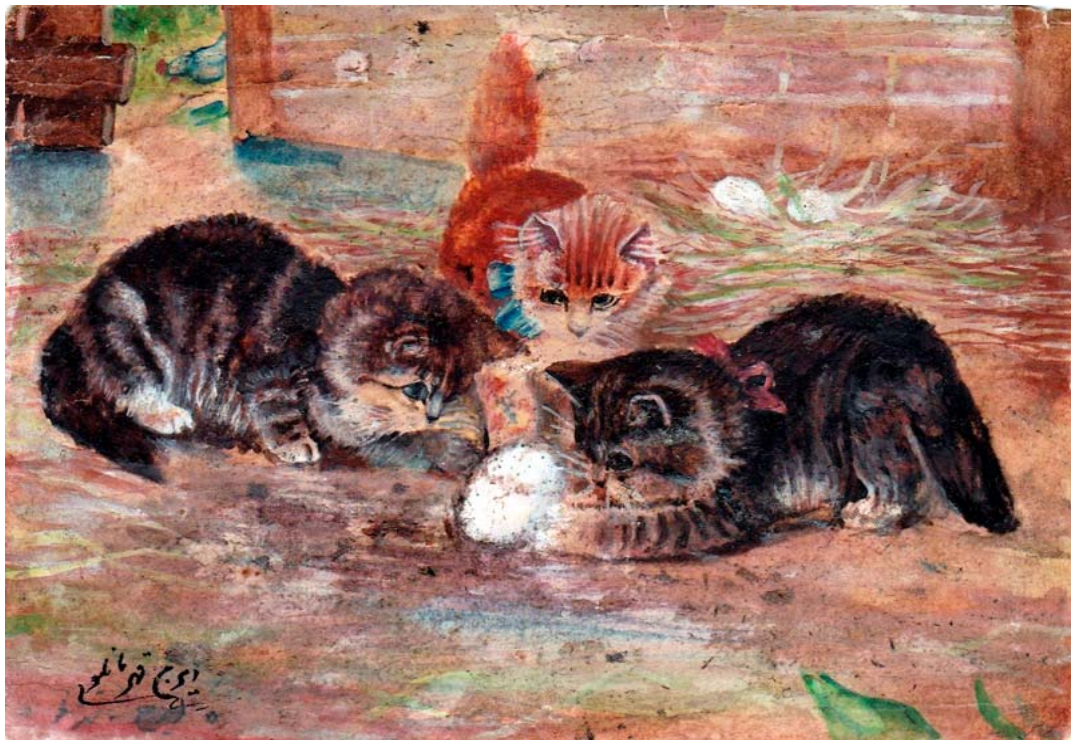
آبرنگ، سال ۱۳۴۲