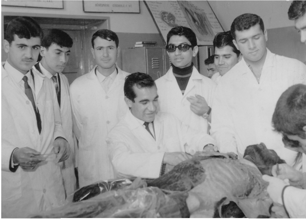
کلاس آناتومی، زمستان ۱۳۴۵ - نگارنده سومین تن از چپ

تقویت موقعیت اجتماعی خود استفاده می کرد.