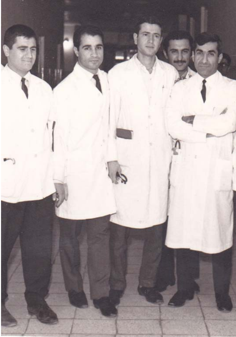
بیمارستان دانشگاه، سال ۱۳۴۸